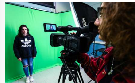
Audiovisivo e Multimediale